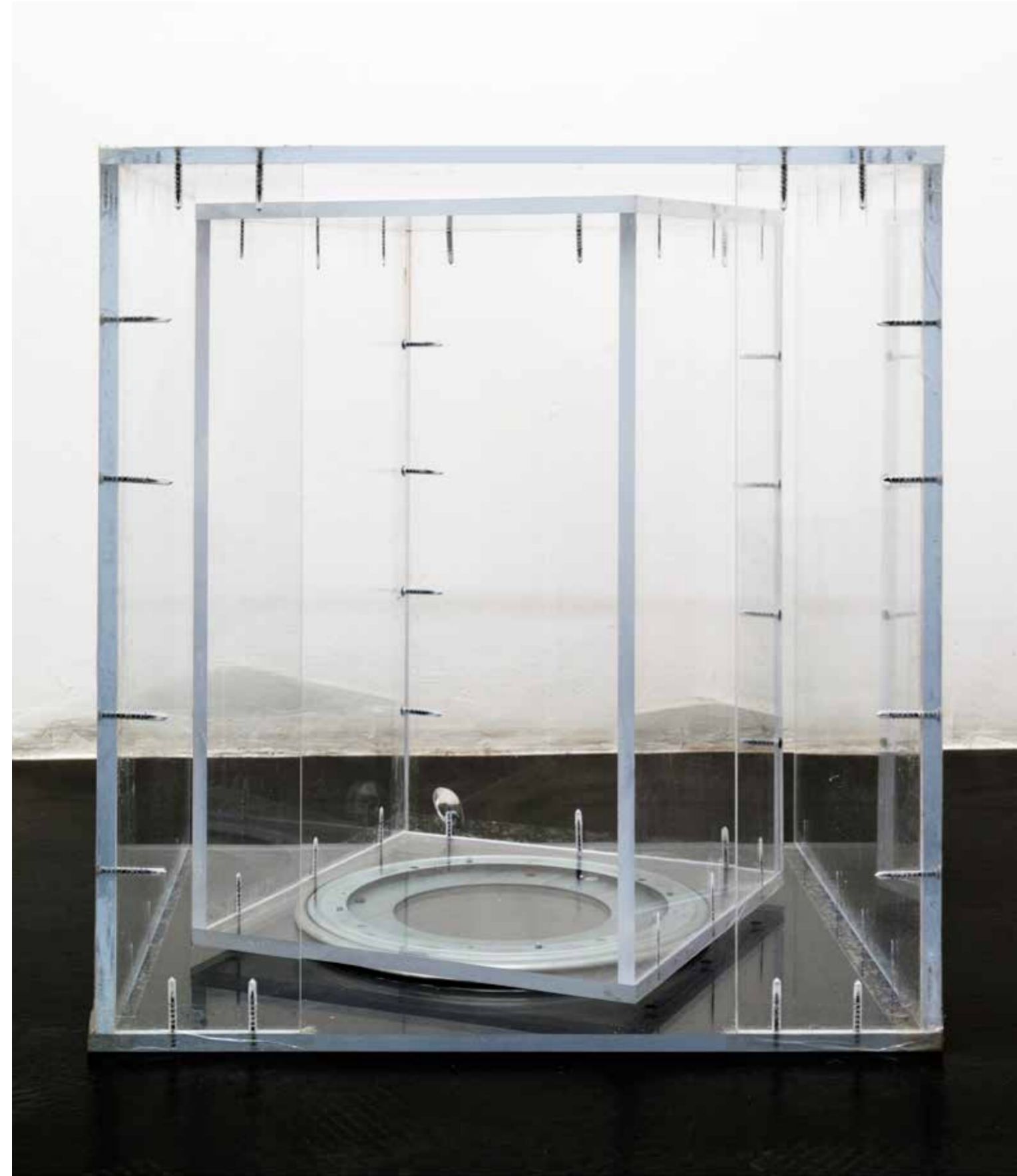
Pass-Thru, 2013

“Target hardening” si riferisce al processo di messa in sicurezza di un sito, al fine di proteggerlo e di ridurre il rischio di rapina. Cameron Rowland nel suo recente lavoro lo utilizza come cornice di riferimento: la barriera fisica dove due corpi spinti dalla necessità entrano in contatto – e la considerazione sociale che influenza quell’interazione.